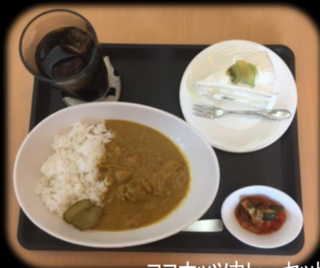
ココナッツカレーセット